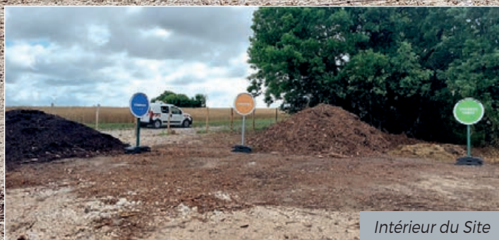
Intérieur du Site