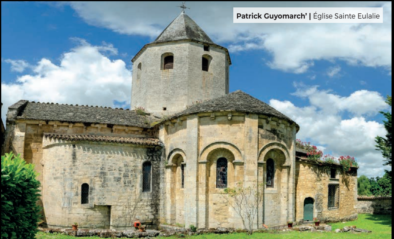
Patrick Guyomarch' | Église Sainte Eulalie