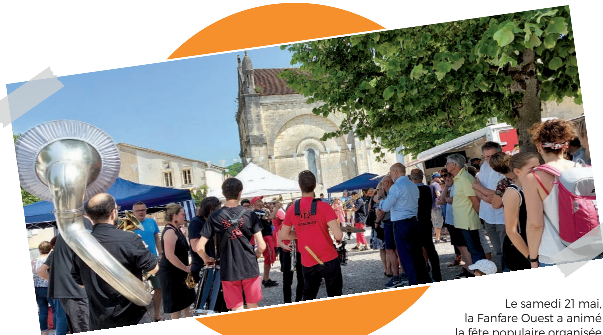
Le samedi 21 mai, la Fanfare Ouest a animé la fête populaire organisée lors de l'inauguration de la place de l'église.

Ainsi, nos efforts sont multiples : effacement de friches industrielles, création de jardins familiaux et pédagogiques, agrandissement de jardins publics, structuration et aménagement de cheminements doux, création de lieux de vie partagés et intergénérationnels... Tout cela contribue au bien-être des habitants.