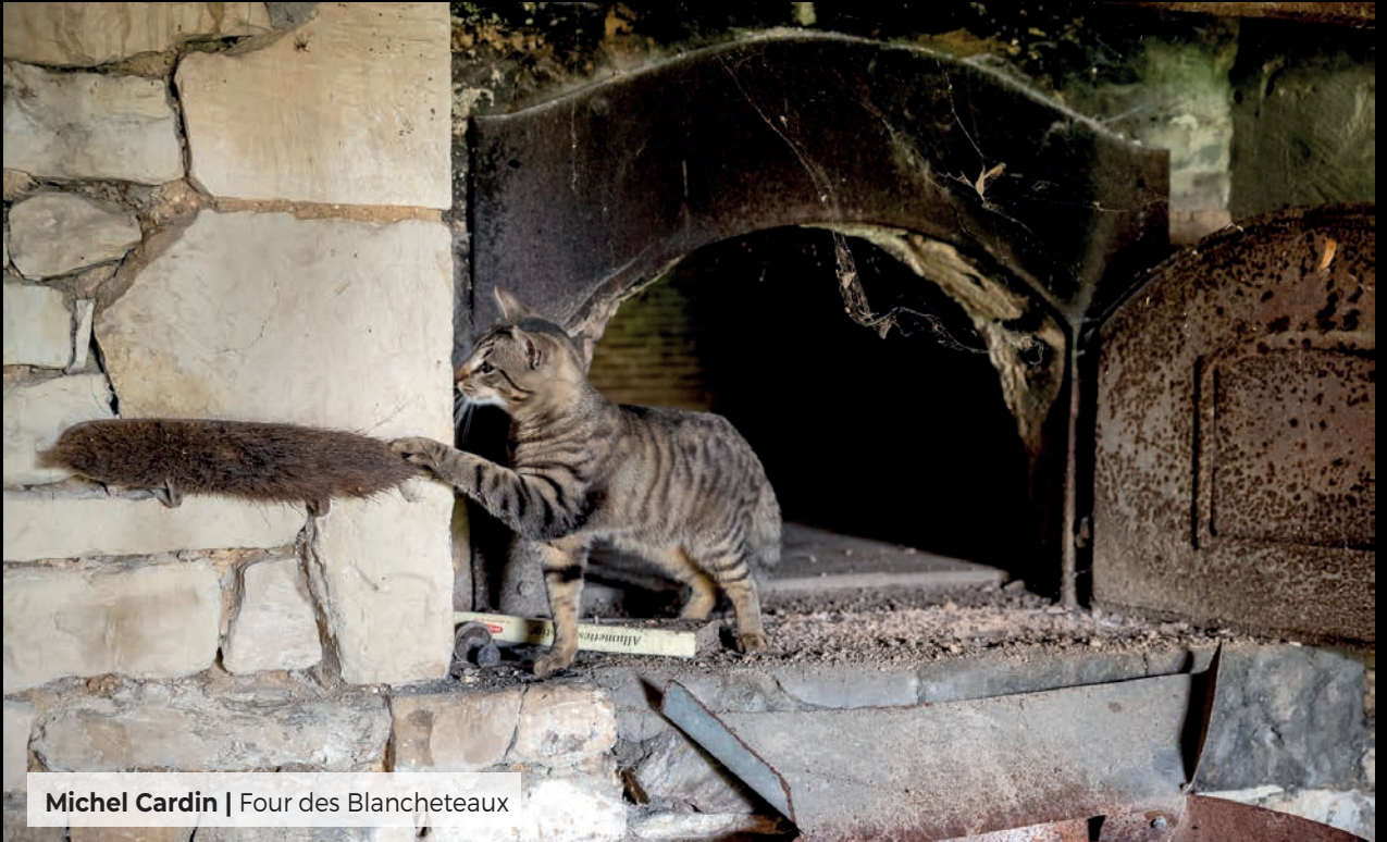
Michel Cardin | Four des Blancheteaux