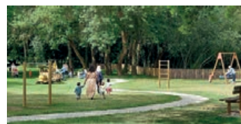
Aménagement aux Prés de l'Or