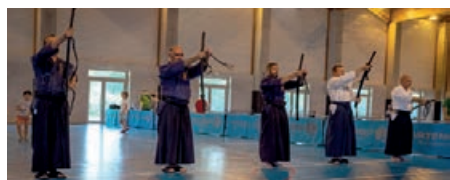
La Fête du Sport et des Associations