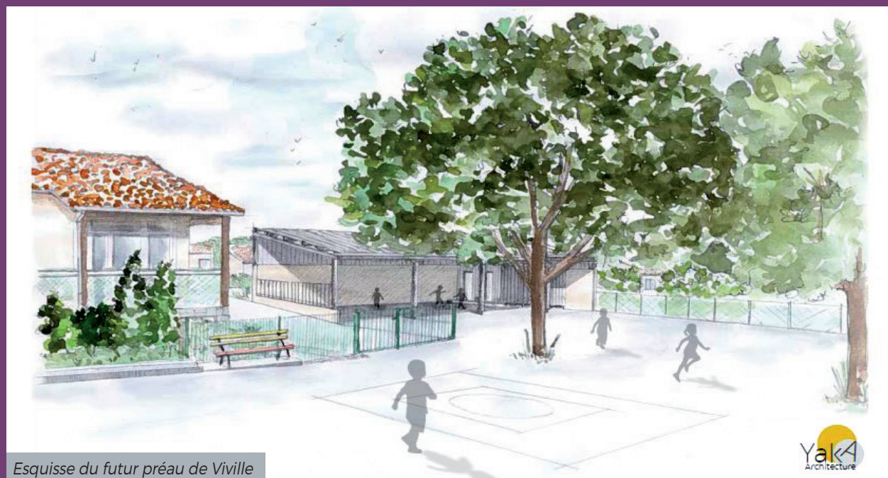
Esquisse du futur préau de Viville