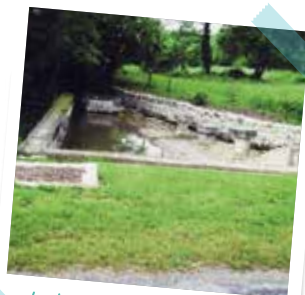
le lavoir des Bouillons