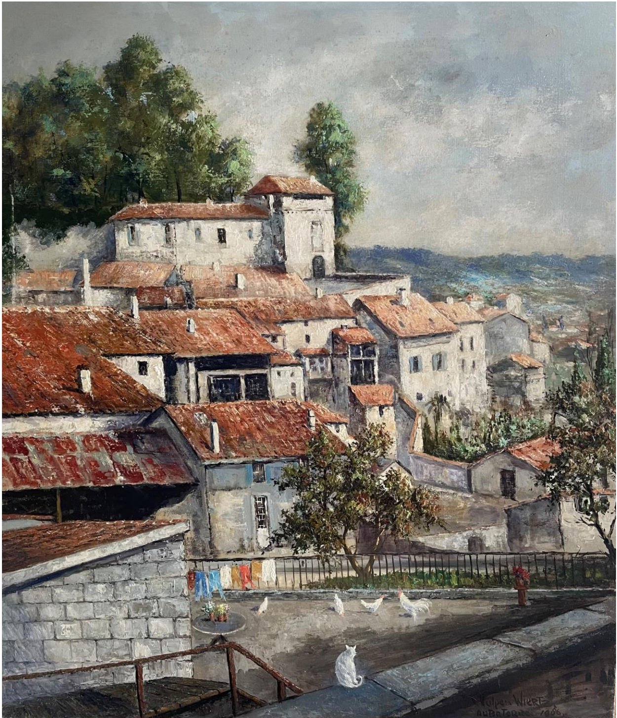
Huile sur bois 80 x 70 cm