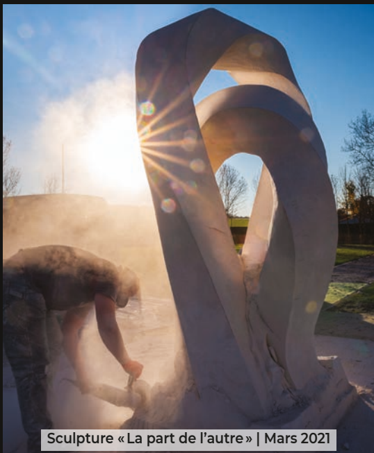
Sculpture « La part de l'autre » | Mars 2021