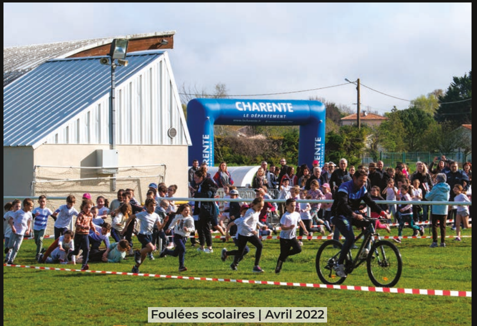
Foulées scolaires | Avril 2022