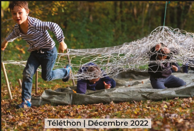
Téléthon | Décembre 2022