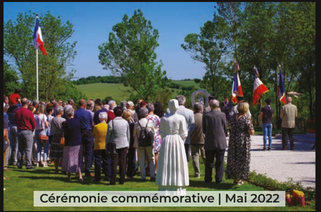
Cérémonie commémorative | Mai 2022