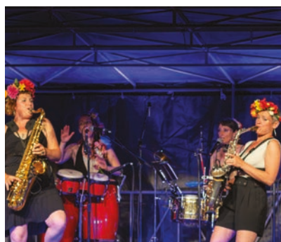
Concert - Las Gabachas