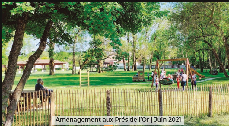
Aménagement aux Prés de l'Or | Juin 2021