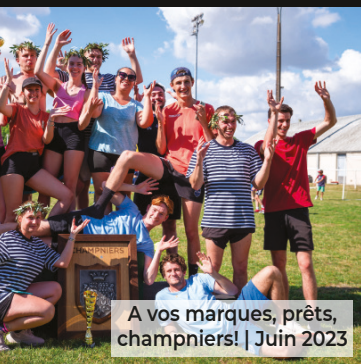
A vos marques, prêts, champniers! | Juin 2023