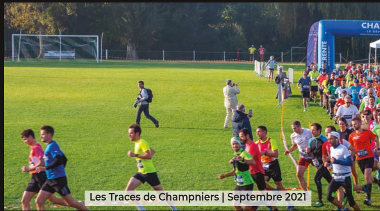
Les Traces de Champniers | Septembre 2021