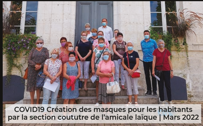
COVID19 Création des masques pour les habitants par la section couture de l'amicale laïque | Mars 2022