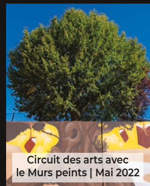
Circuit des arts avec le Murs peints | Mai 2022