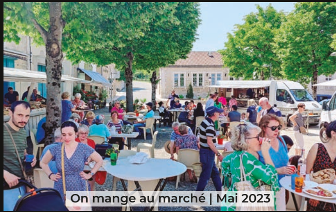
On mange au marché | Mai 2023