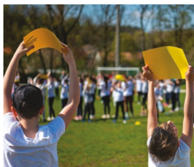
Semaine Olympique et Paralympique