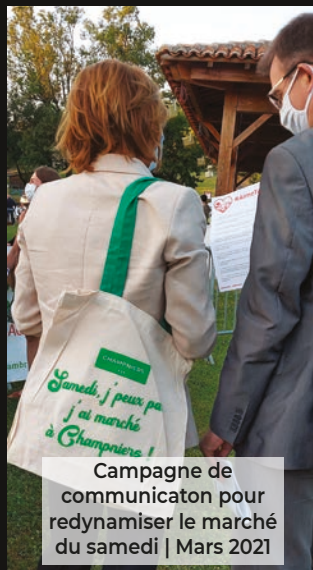
Campagne de communication pour redynamiser le marché du samedi | Mars 2021