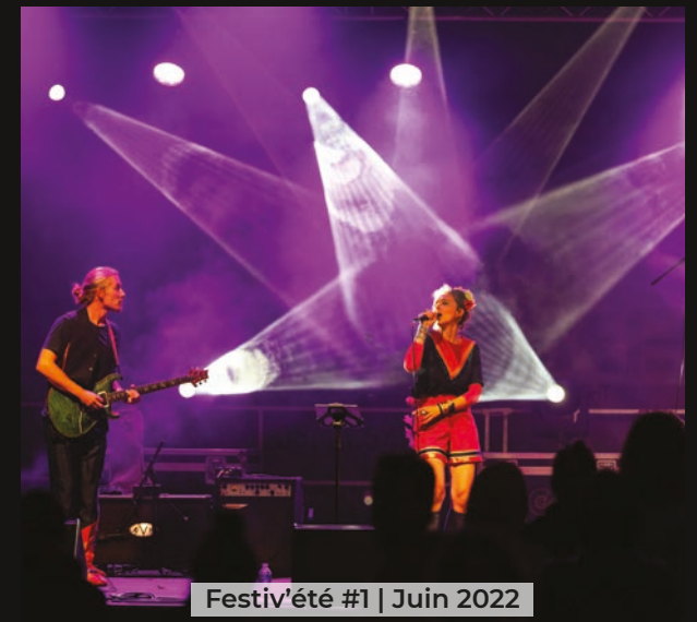
Festiv'été #1 | Juin 2022