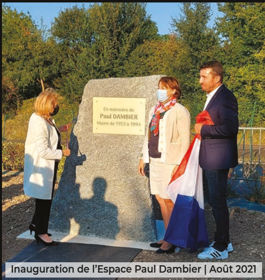
Inauguration de l'Espace Paul Dambier | Août 2021