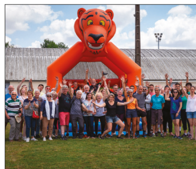
La Fête du sport et des associations