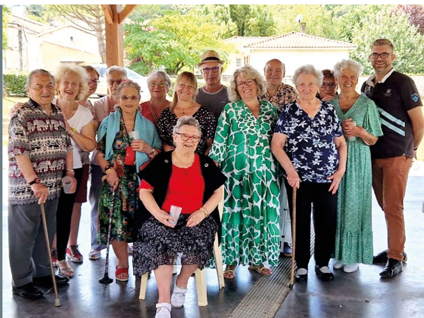
Le réseau recherche des bénévoles, faites-vous connaître auprès de la mairie !

Le réseau de solidarité vise à mettre en relation des habitants isolés, en situation de handicap, avec des bénévoles pour une visite de courtoisie à domicile et partager un moment de rencontre conviviale.