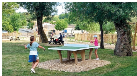
Aménagement de l'Espace vert Guy Denis