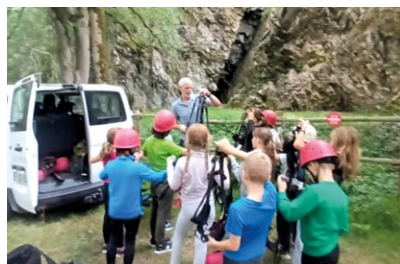
L'été aux accueils de loisirs